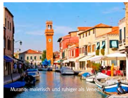
Murano: malerisch und ruhiger als Venedig