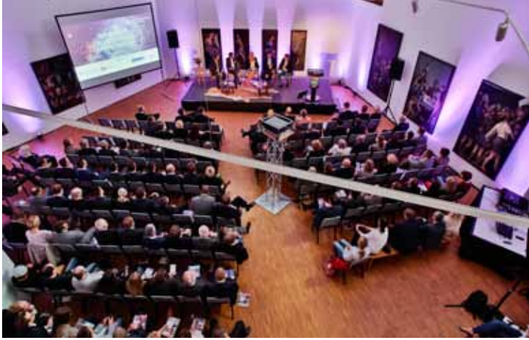
Beim „Unternehmerforum Südwestfalen“ steht der persönliche und fachliche Austausch im Vordergrund. 2015 waren rund 150 Besucher bei der Premiere im Hagener Osthaus Museum dabei