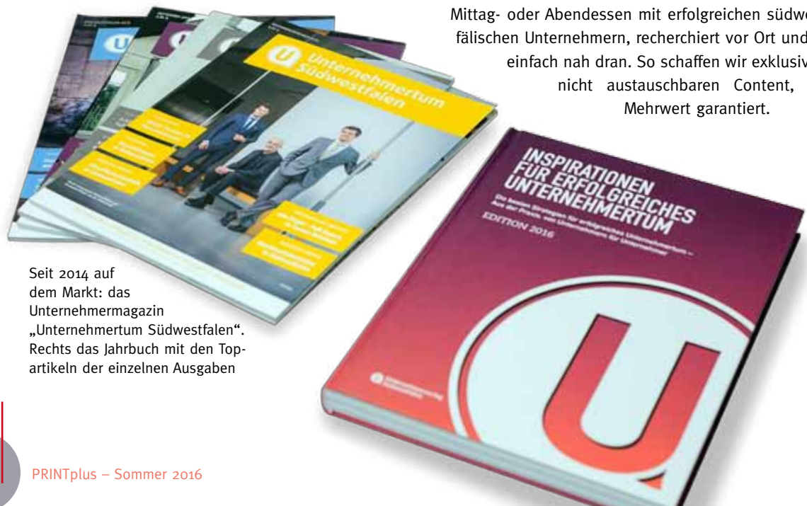
Seit 2014 auf dem Markt: das Unternehmertummagazin „Unternehmertum Südwestfalen“. Rechts das Jahrbuch mit den Topartikeln der einzelnen Ausgaben

Entscheidend – wir spielen die regionale Komponente bewusst. Und erreichen so eine hohe Emotionalität und Identifikation. Auf dem Magazin steht „Unternehmertum Südwestfalen“ drauf und das ist auch zu mindestens 90 Prozent drin. Wenn wir über das Thema Innovationskultur sprechen, stellen wir den konkreten Bezug zu hiesigen Unternehmen her. Unsere Leser bekommen Statements aus ihrer Umgebung, Fotos mit Gesichtern aus dem Umfeld. Das Redaktionsteam führt z. B. Interviews beim gemeinsamen Mittag- oder Abendessen mit erfolgreichen südwestfälischen Unternehmern, recherchiert vor Ort und ist einfach nah dran. So schaffen wir exklusiven, nicht austauschbaren Content, der Mehrwert garantiert.