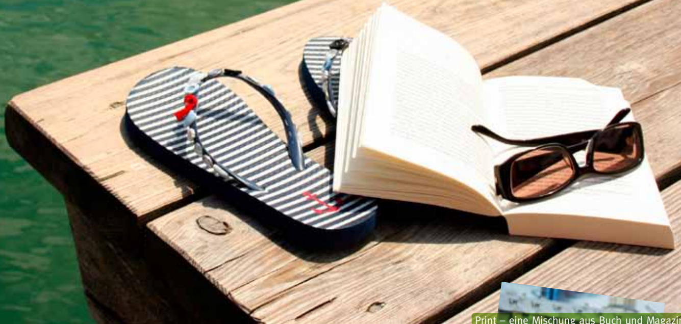
Print – eine Mischung aus Buch und Magazin