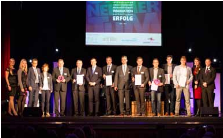
Beim „Unternehmerpreis Südwestfalen“ wird einmal jährlich erfolgreiches südwestfälisches Unternehmertum ausgezeichnet – in den Kategorien Unternehmer, Gründer und Projekt