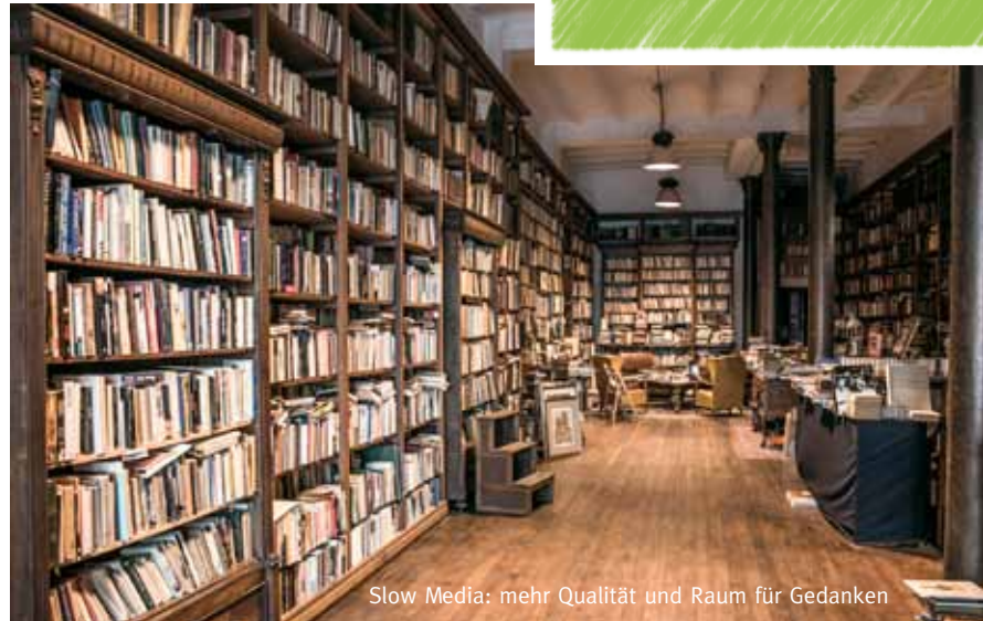
Slow Media: mehr Qualität und Raum für Gedanken

... hört sich gut an. Wir sind sehr gespannt, was uns auf der drupa 2016 erwartet. Und werden Ihnen in der nächsten Ausgabe der PRINTplus die wichtigsten Infos vorstellen.